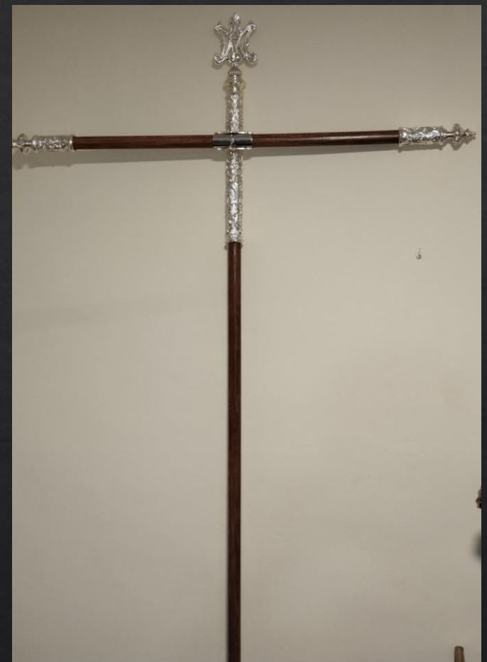
Mod PE-3 Madera y repujado.