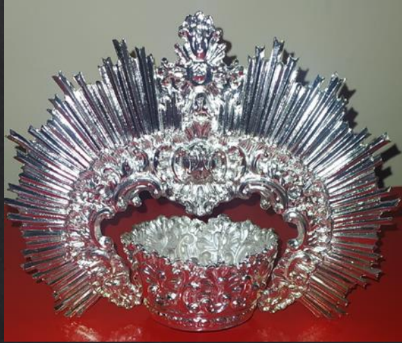
Mod Corona-3 5cm