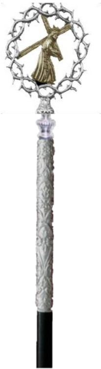
Mod BAC-1 Madera y repujado