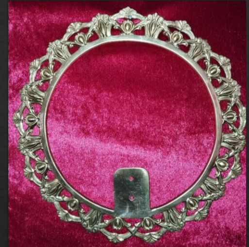
Mod AUREOLA- 1