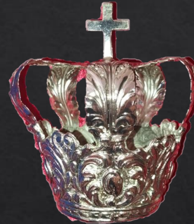
Mod Canasto-1 7cm