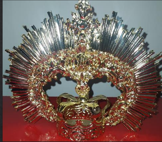
Mod Corona-4 6cm