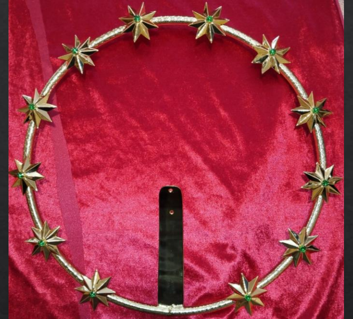
Mod ARO ESTRELLAS-1