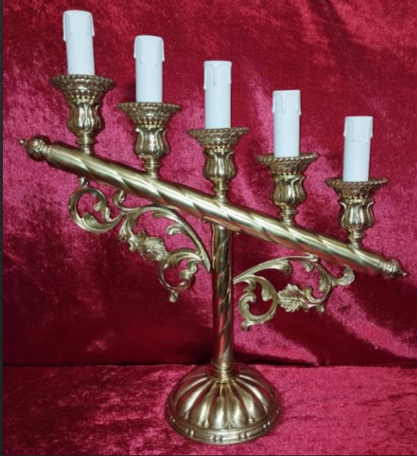
Candelería eléctrica altar.