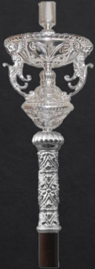
Mod CI-1 Madera y repujado