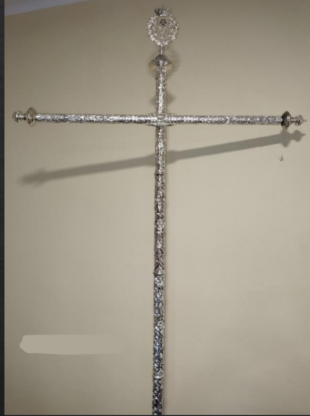
Mod PE-2 Repujado

Posibilidad de repujado, madera y repujado, latón grabado o salomónico